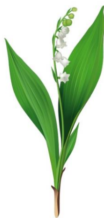
Un brin de muguet