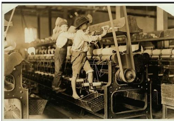
Ici, tu peux voir deux enfants dans une usine de tissus au milieu d'immenses machines extrêmement bruyantes et dangereuses.

Ce n'est quand 1906 (c'était il y a 114 ans), que les ouvriers ont obtenu le droit de se reposer une fois par semaine, le dimanche. Et ils n'avaient pas de vacances. Jamais.