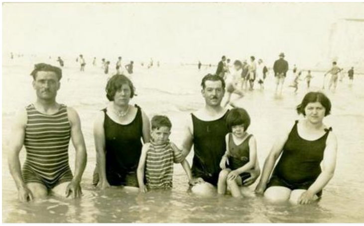
Les gens découvrent la mer. Tu as vu leurs maillots de bain ?