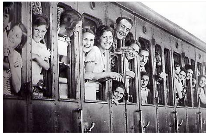
On part en train à vapeur. Les voitures sont très rares.

Aujourd'hui nous avons 5 semaines de vacances et le temps de travail a encore diminué. Je ne sais pas comment cela sera pour toi plus tard, car le monde change vite. Aujourd'hui beaucoup de choses sont par exemple fabriquées par des robots ou faites par des ordinateurs. Les machines prennent le travail de certaines personnes tandis que certains métiers manquent de gens pour les faire. Nous devons faire des choix pour permettre à chacun de pouvoir gagner sa vie et avoir sa place dans la société.