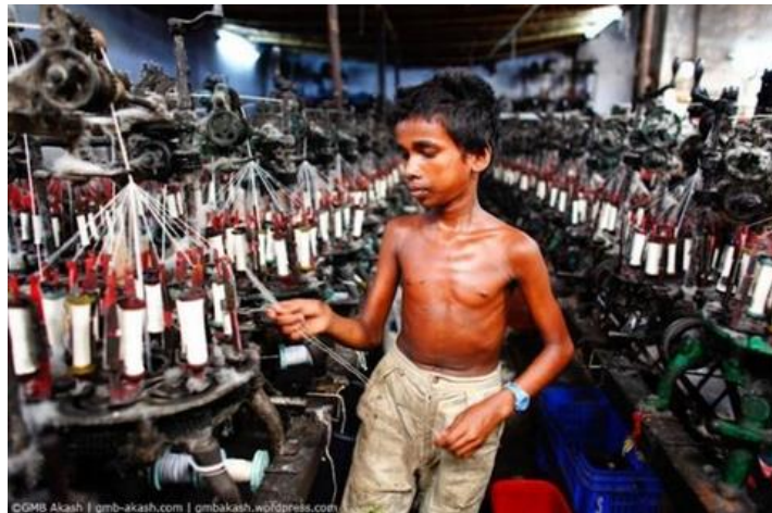
Ici, tu peux voir un enfant travailler actuellement dans une usine qui fabrique des tissus.

Enfin, pour terminer, nous ne devons pas oublier qu'à travers le monde des enfants continuent de travailler dans des conditions très difficiles !