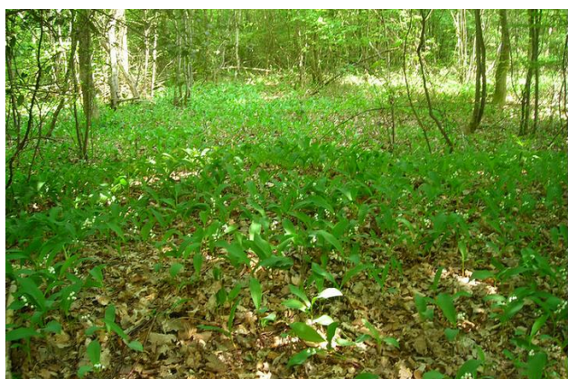
On trouve souvent du muguet dans les bois.

C'est beau, mais attention, n'en mange pas, c'est une plante toxique !