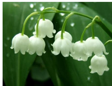
Les fleurs du muguet en forme de clochette.

Elles sont belles ces clochettes... J'aimerais bien savoir les dessiner.